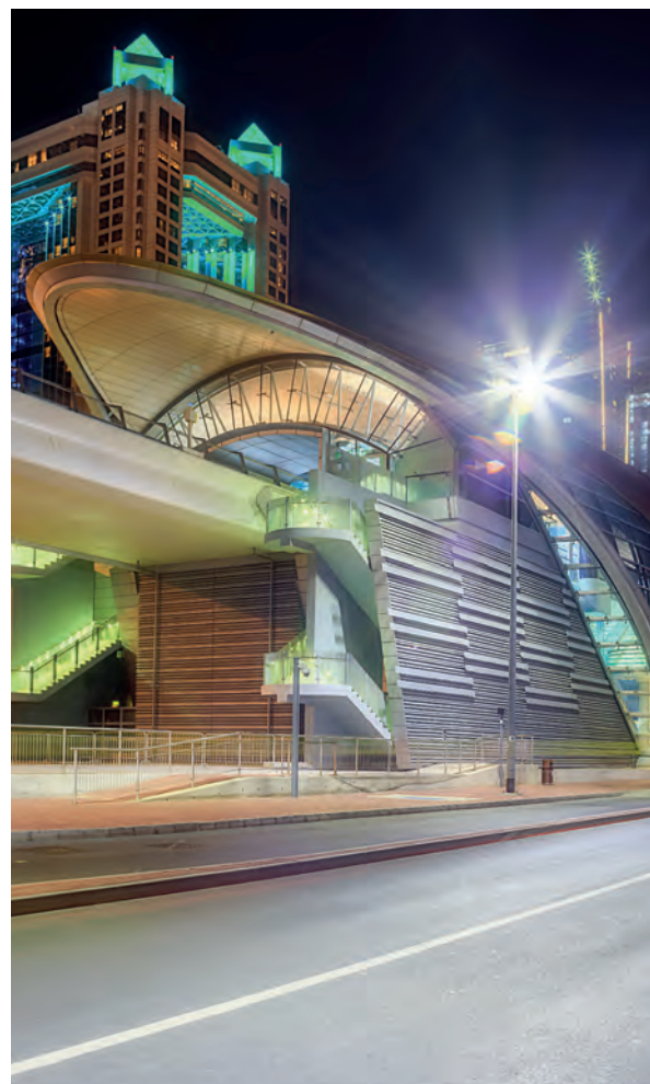
Дубайська станція метро Burj Khalifa – охороняється SteelMaster

Фарба SteelMaster завжди забезпечить відмінний рівень вогнезахисту.